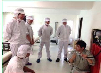
↑ 新しい消火設備の 説明を受けてます！

まず、消防設備の会社の人から説明を受け、1人ずつ「 火事だ！！ 」と大声で叫んだあと三角コーン（火の代わり）に向かって手前からジグザグに消火器（中身はお水です！）を噴射していきます。それから火元に向かって噴射するのがポイントだと教わりました。