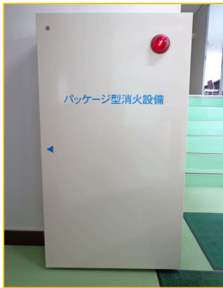
↑ 新しく設置した消火設備です！

先日、消防署の人立ち合いのもと社内の設備点検を行い、新たに消火設備などを追加設置しました。この機会にみんなで使用方法を教わり、消火訓練を行いました！